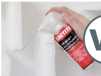
乐泰 M18 万能金属养护剂